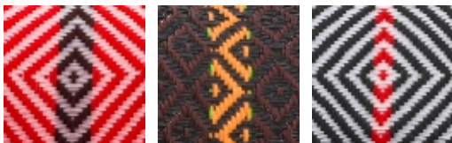
rouge - blanc - noir oxyde - noir - orange blanc - noir - rouge