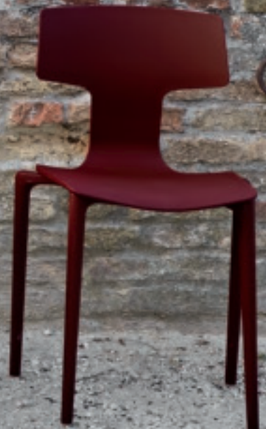
Melanzana Aubergine Berenjena NCS S 5540-Y90R