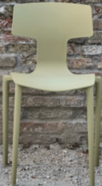
Sabbia Sand Arena NCS S 3010-Y

Para mas detalles sobre las versiones bicolor ver las informaciones en www.colos.it