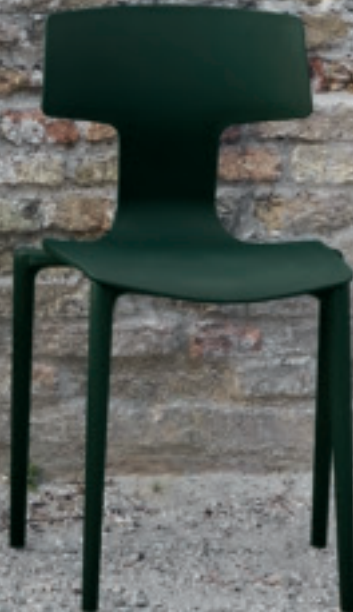
Verde scuro Dark Green Verde oscuro NCS S 8010-G10Y