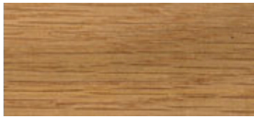
B1.2 - OAK placage chêne vernis varnished veneer oak